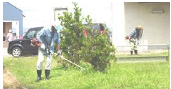
地域の皆様による草刈