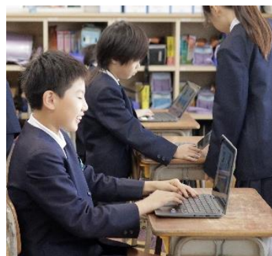
環境委員会「クイズ&ゲーム」