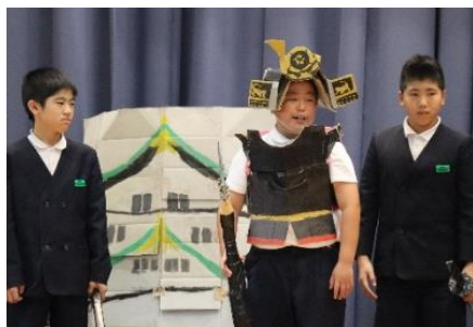
6年 劇「末森城の合戦」