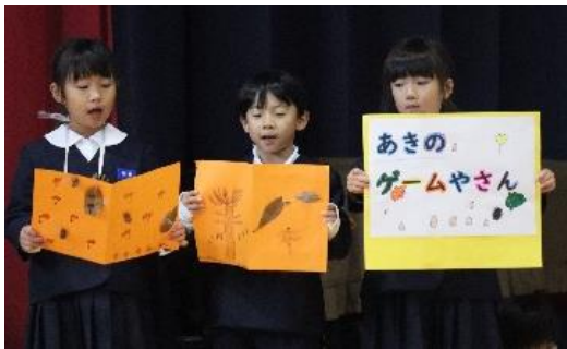
お店紹介「皆さん、来てください」

これまで1～3年生はお客さんとしてお店を回って楽しむだけでしたが、今年は1～3年生もお店を企画しました。協力して準備をしたり、一生懸命ルールの説明をしたり、来てくれた人を楽しませようと低学年もめあてをもって頑張っていました。学校公開に合わせて来られた保護者や地域の方もお客さんになってくださり、相見っ子まつりに参加した全ての学年が「自分が楽しい」だけでなく「みんなが楽しんでくれることがうれしい」という体験ができました。