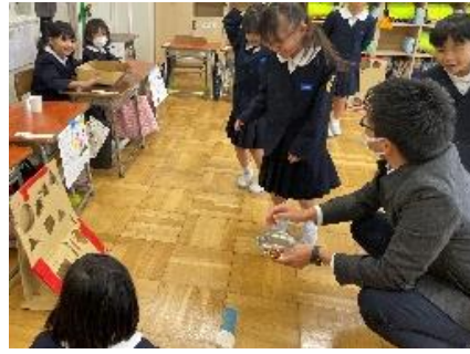
1年「秋のゲーム屋さん」