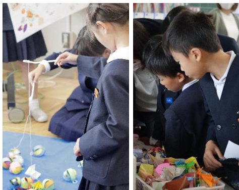
3年「3年スーパーマーケット」