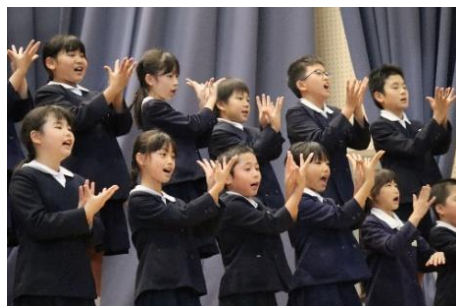
4年 歌と手話「ありがとうの花」