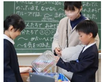
2年「おもちゃランドへようこそ」