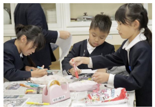
図書委員会「プラ板バンバン」