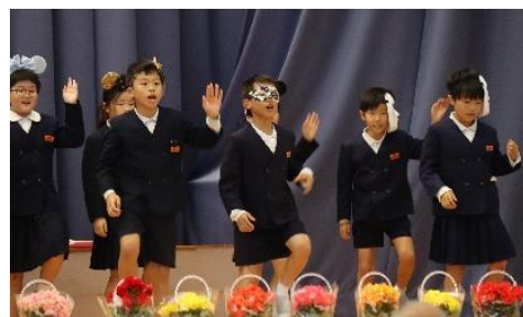
3年 ダンス「ミッキーマウスマーチ」