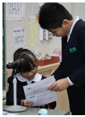
放送委員会「ほうそうビンゴ」