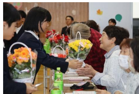
ボランティアの方へプレゼント渡し