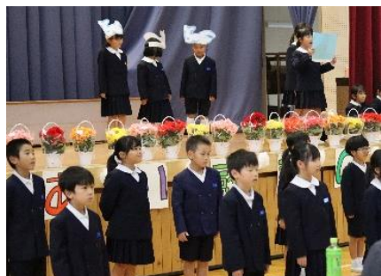
1年 音読劇「くじらぐも」

11月1日(金)に、学校ボランティアの方々を招いて「ふれあい感謝の集い」を行いました。日頃お世話になっているボランティアの方々に感謝の気持ちを伝えようと、各学年が出し物を披露したり、感謝状やプレゼントを渡したりしました。ボランティアの方々と子供たちの笑顔があふれる温かな時間を過ごすことができました。保護者の皆様もご参観ありがとうございました。