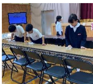
5年 準備や企画・運営にがんばった5年生