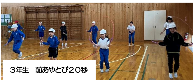
3年生 前あやとび20秒