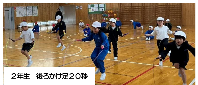
2年生 後ろかけ足20秒