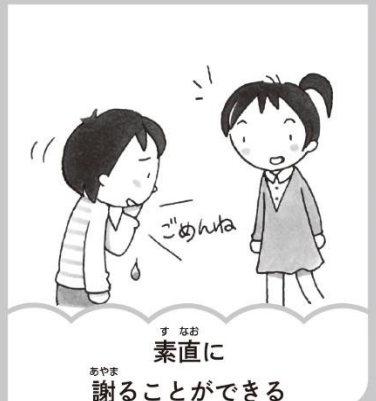
素直に謝ることができる