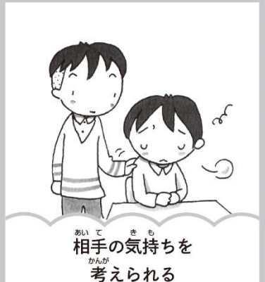
相手の気持ちを考えられる