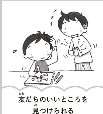
友だちのいいところを見つけられる