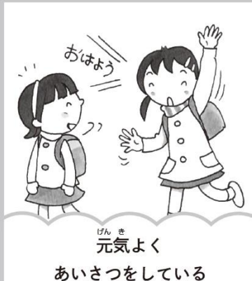
元気よくあいさつをしている