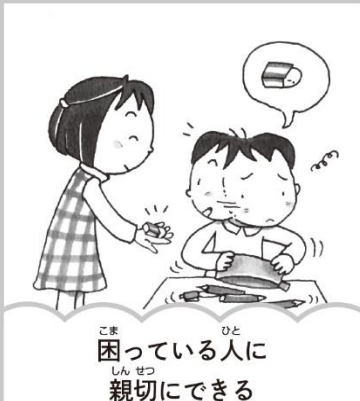
困っている人に親切にできる