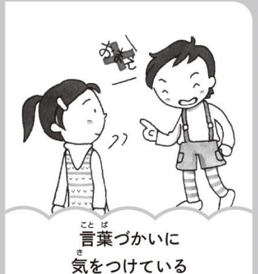
言葉づかいに気をつけている