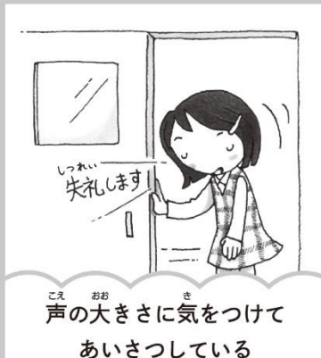
声の大きさに気をつけてあいさつしている