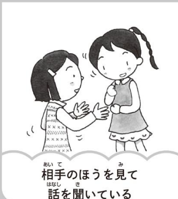
相手のほうを見て話を聞いている