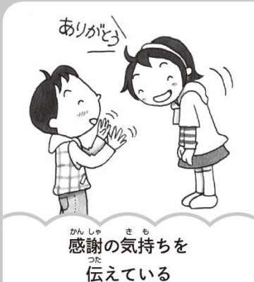
感謝の気持ちを伝える