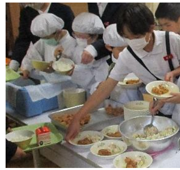
〔きれいによそってます〕