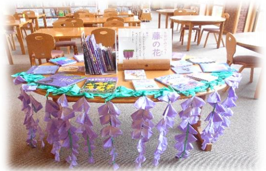
【メディアルーム「季節の展示」より】

今週末には、今年度最初の授業参観があります。ご多用中とは存じますが、子供たちの頑張っている姿をぜひ見に来ていただけたらと思いますので、よろしく願いたします。