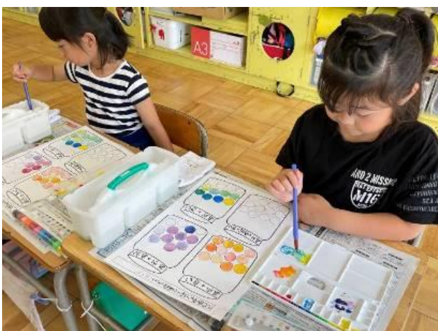
絵の具で混ぜ色キャンディーづくり