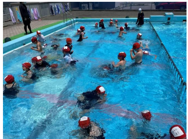
プールでの貝拾い