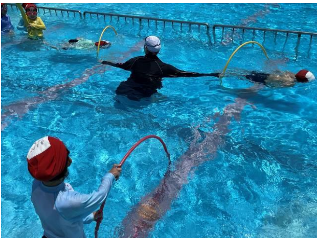
プールでのフラフープくぐり