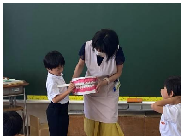
養護教諭による歯の磨き方指導