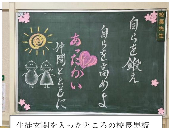
生徒玄関を入ったところの校長黒板