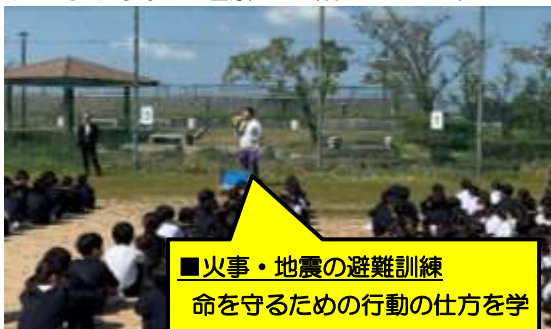
■火事・地震の避難訓練 命を守るための行動の仕方を学びました

先日の授業参観、PTA 総会、学年懇談会には多数のご参加をいただきありがとうございました。今後とも、保護者・地域の皆様とともに、子供たちが安心して元気に、意欲的に学ぶことができる学校を目指して努力してまいります。ご理解・ご協力のほど、よろしくお願いいたします。