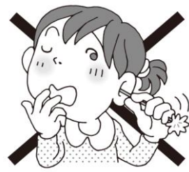
耳そうじをやりすぎない