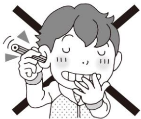
耳に異物を入れない