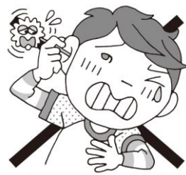
耳かきを奥まで入れない