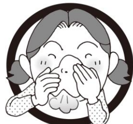
片方ずつおさえて鼻をかむ