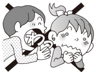
耳元で大声を出さない