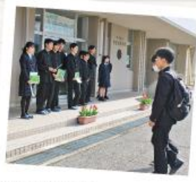
緑の羽根募金活動