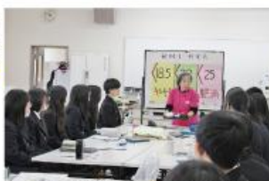
食育講座（「生活習慣病の予防」講座）