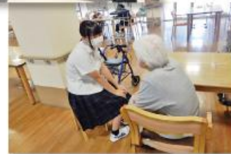
インターンシップ▲