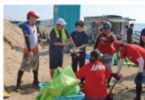
ジェットスキーボランティア