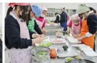
食育講座（「生活習慣病の予防」調理実習）