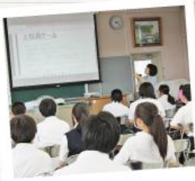
カウンセリングアワー