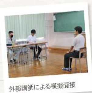
外部講師による模擬面接