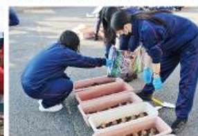
プランターづくり