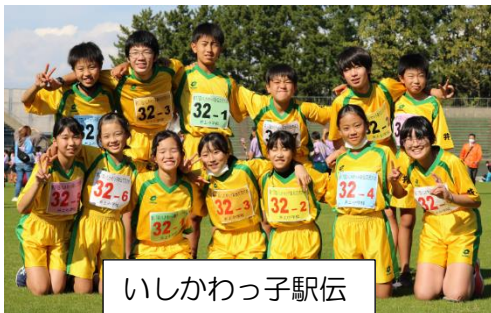
いしかわっ子駅伝

秋も深まる10月下旬から11月下旬までは「スポーツの秋」「食欲の秋」「芸術の秋」などを満喫できる行事が目白押しでした。特にいしかわっ子駅伝・