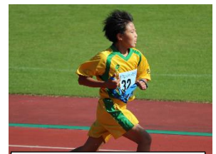
いしかわっ子駅伝

5年キゴ山体験学習・2年さつまいもの茶巾しぼり・3年生け花体験教室では、人とのつながりを重視しながら活動を行いました。もちろんできるだけ感染予防を行った上での活動です。そこかしこに満面の笑みを見ることができました。