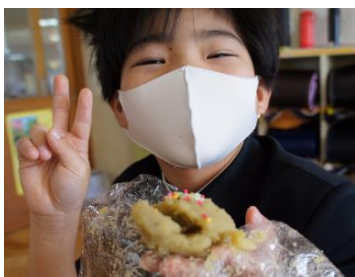
さつまいもの茶巾しぼり