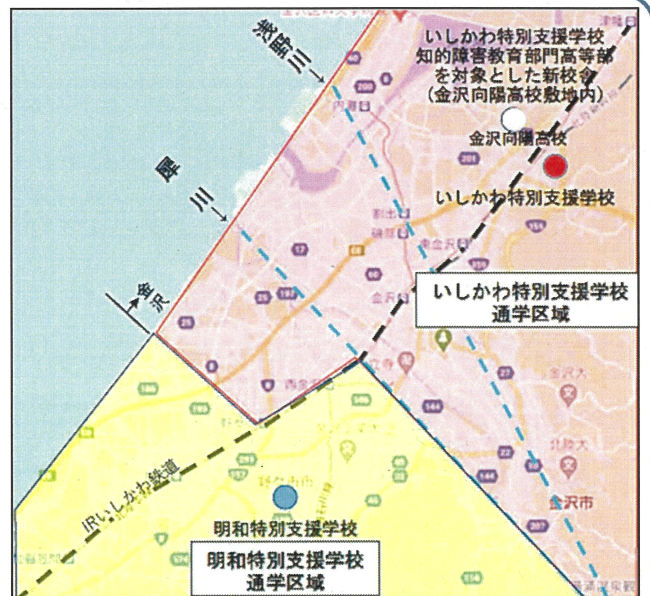
【マップ】 知的障害教育部門通学区域（R7年度～）

※知的障害教育部門については、本校と石川県立明和特別支援学校との 選択区域はありません。