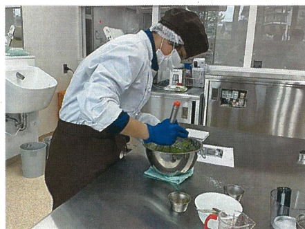
産業技術コース フードデザイン