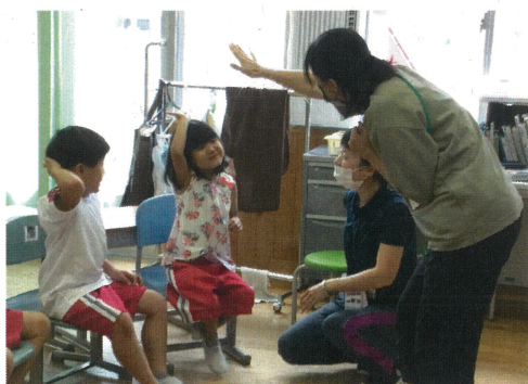
日常生活の指導（朝の会）