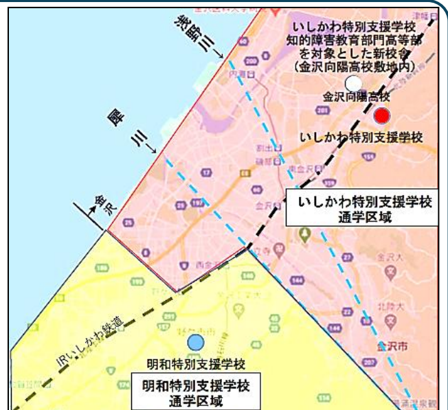
【マップ】 知的障害教育部門通学区域（R7年度～）

※知的障害教育部門については、本校と石川県立明和特別支援学校との選択区域はありません。