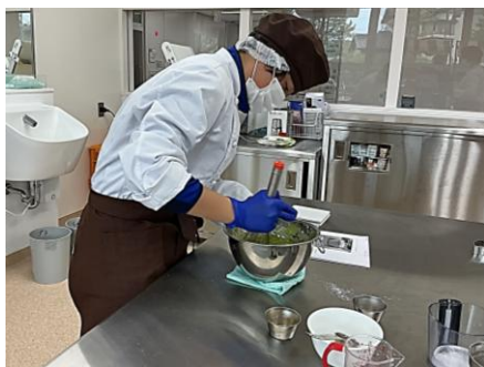
産業技術コース フードデザイン