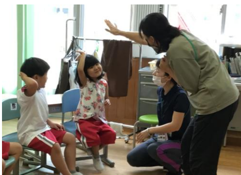
日常生活の指導（朝の会）