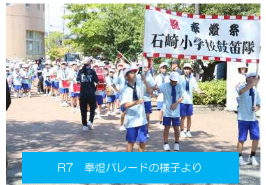
R7 奉燈パレードの様子より

これから、しっかりと練習を重ね、本番では、生き生きと活気にあふれるマーチングパレードをふるさと石崎にお届けできるよう、仲間とともに助け合い、励ましながら、やり遂げてほしいと願います。保護者のみなさん、地域のみなさん、本番当日の子どもたちの雄姿をご期待ください。応援をよろしくお願いいたします。