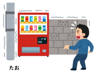
たお 倒れそうなもの