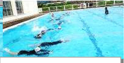
5年生自分のめあて達成のために練習