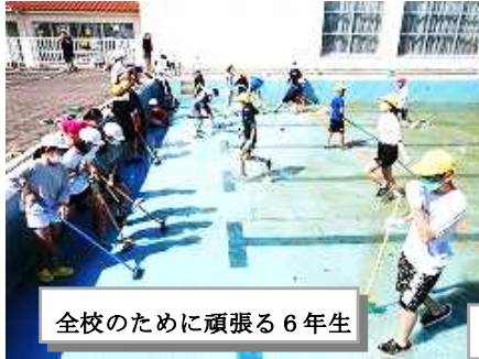
全校のために頑張る6年生

6月9日(木)、6年生がプール掃除をしてくれました。6年一人一人が力を出してくれたおかげで、こんなに大きなプールの汚れを取り除くことができ、ピカピカのプールになりました。6月16日(木)にはプール開きを行い、全校のみんながプール学習を楽しんでいます。今年度も、新型コロナウイルス感染対策を徹底しながらプール学習を進めています。学年に応じて、自分の泳ぎの目標を決め、約束を守ってプール学習に励んでいます。小学生のうちに、「いのちを守る泳ぎ」ができるようになってほしいと願っています。