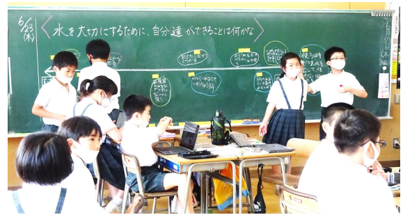
司会をして主体的に学び合う条南っ子(社会科)

6月22日(水)の授業参観、引き渡し訓練、ありがとうございました。4月の授業参観以来2か月ぶりでしたが、お子様の学校での様子はいかがでしたでしょうか。前回の4月は、新しい学級となり幾分緊張気味だった子供たちも、6月にはクラスの信頼関係も構築され、その結果、安心して自分の意見を話すことができ、落ち着いた学び合いになってきていると感じています。1時間の真剣な学び合いの積み重ねが確かな力となっていくしますので、子供たちの知的好奇心が高まり、主体的な学びとなるように、我々教職員も、日々手立てを工夫し研鑽に努めているところです。