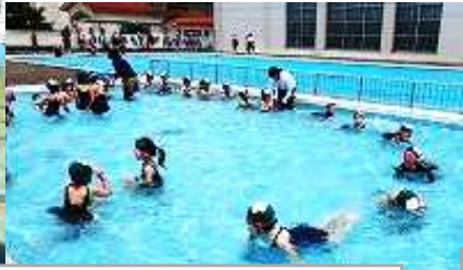
1年生小学校で初めてのプール学習