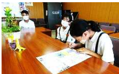
いじめ撲滅宣言の調印式

この3つの宣言には、笑顔いっぱいの楽しい学校にするための条南っ子の願いが込められています。このいじめ撲滅宣言を条南っ子みんなで確認し、振り返りながら実現させていきたいと思ひます。