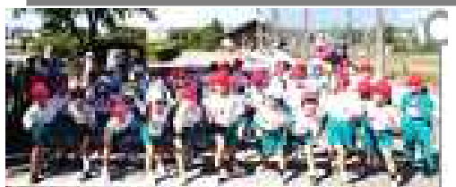
1年生小学校初めてのマラソン大会スタート!

自分の目標を立て、走ろう運動で練習し、粘り強くがんばった校内マラソン大会10月24日