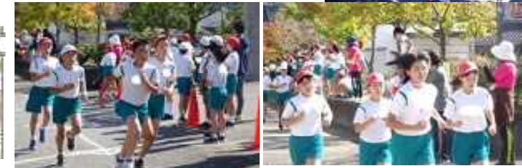
6年生は小学校最後のマラソン大会をみごと走りぬきました