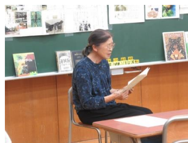
やまんばんさんのお話会

こちらで紹介した活動はごく一部です。今年度も保護者の方々、地域の皆様、どうぞご理解・ご協力のほど、よろしくお願いいたします。