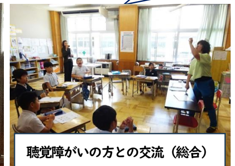
聴覚障がいの方との交流（総合）