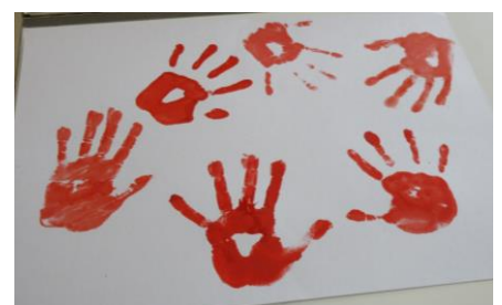
手形で作成したデザイン