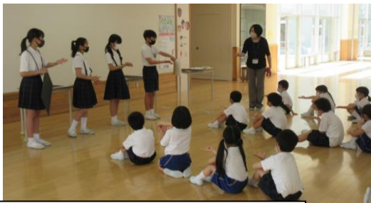
6年生が、1年生に団旗づくりについて説明している様子

新型コロナウイルス感染症対策のため、1学期は運動会等の全校行事を開催することができません。そこで、「団！！盛り上げ project」を立ち上げました。赤、白、青、黄の4つの縦割りの団の団旗を全学年の協力を得て作成することにしました。各団の6年生は、どんな団旗にするのか、各学年に何をしてもらうのか、どのように説明するのかなど、休み時間を活用して話し合っていました。そして、6月9日(水)の5限目に各学年に団旗の制作に協力してもらうことになりました。各団の6年生は、一生懸命に下級生に説明していました。下級生を動かすことの大変さを6年生なりに感じていたようです。