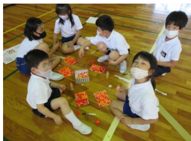
ちぎり絵をしている2年生