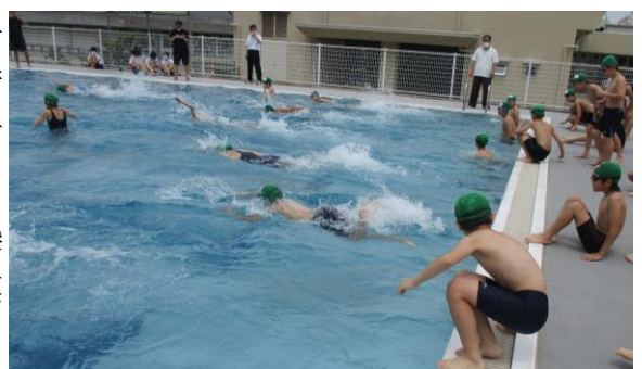
初泳ぎを気持ちよく楽しみました!

6年生に限らず、全校児童が、新型コロナウイルス感染症対策も含めて、健康や安全に気をつけて、しっかり目標をもちながら、「がんばった。楽しかった。」と思えるような水泳の学習になるように取り組んでほしいと思います。