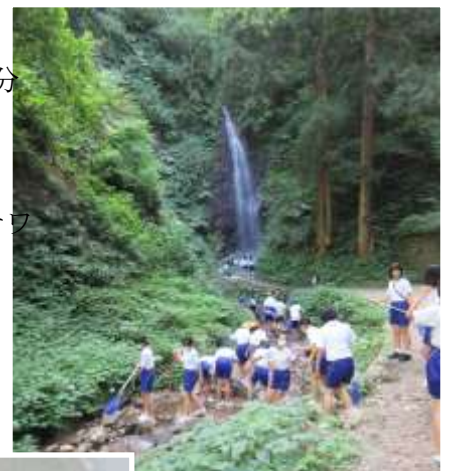
不動滝で生物調査をしている6年生

6年生は、総合的な学習の時間に「中能登町の美しい自然」について調べています。書籍やインターネットで調べるだけでなく、実際に自分たちで水質や生き物を調査しています。はじめは何も生物が見つからず水の冷たさにも戸惑っていましたが、時間が経つにつれ岩の底などに生物を見つけられるようになってきました。今回の不動滝の調査では、“サワガニ”や“サンショウウオ”、“ヤゴ”、“ヘビトンボ”等、水のきれいな川にしかすめない生物を見つけることができました。見つけた生物は、そっと川に返しました。調査を通して、身近な自然の美しさを実感したのではないのでしょうか。