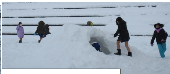
かまぐらで遊んでいる様子