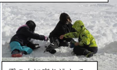
雪の上に座り込んで 遊んでいる様子