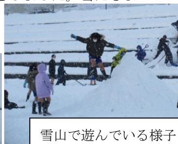
雪山で遊んでいる様子