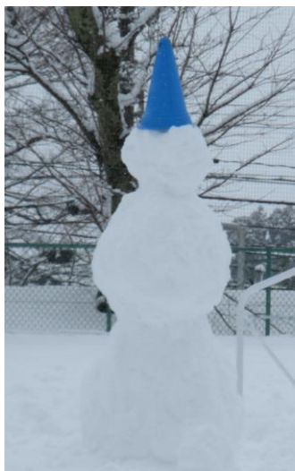
2年生が作成した大型雪だるま