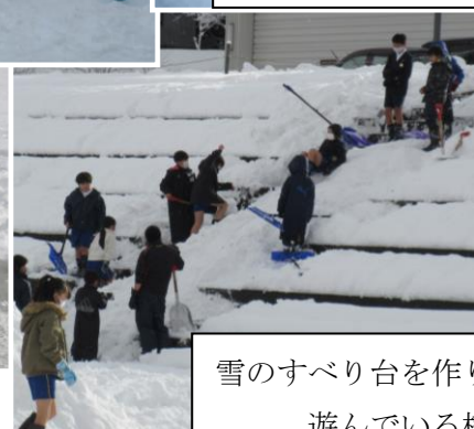
雪のすべり台を作り、 遊んでいる様子