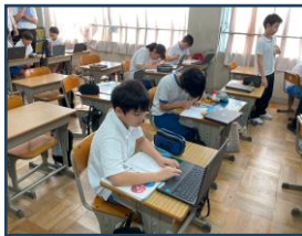
授業の中で、自分で考え動く場面がたくさんありました。子ども達が主体的に学びに向かっている姿をたくさん見ていただきました！！