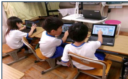
1年生 はじめてのPC学習