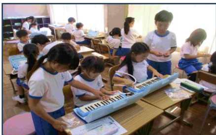
3年生が鍵盤ハーモニカの先生に！