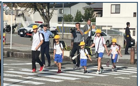
秋の交通安全指導