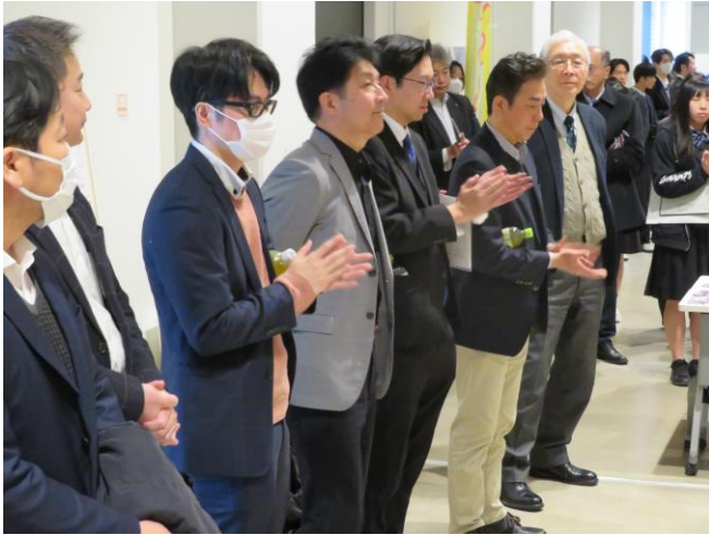
講評いただいた来賓の方々

藤島高(福井県)、高志高(福井県)、富山中部高(富山県)、韓国大田科学高(オンライン)