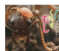
・アリとくらすむし (島田たく 写真・文)