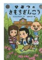
・ひみつのきもちぎんこう (ふじもとみさと 作)