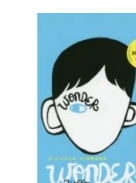
・ワンダー (R.J.パラシオ 作)