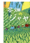
・茶畑のジャヤ (中川なをみ 作)