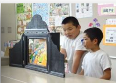
かみしばい 紙芝居