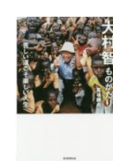
・大村智ものがたり (馬場錬成 著)