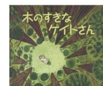
・木のすきなケイトさん (H・ジョセフ・ホブキンス 文)