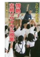
・コロッケ先生の情熱！ (中村文人 文)