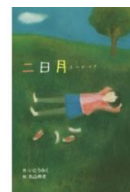
・二日月 (いとうみく 作)