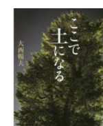
・ここで土になる (大西暢夫 著)