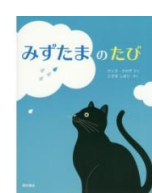
・みずたまのたび (アンヌ・クロザ 作)