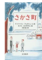
・さかさ町 (F・エマーソン・ アンドリュース 作)