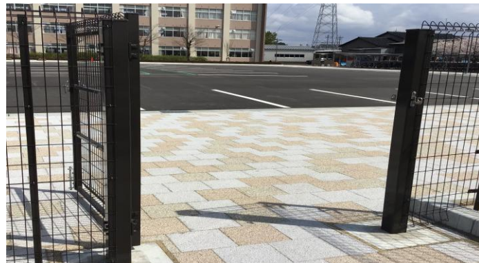
入ったらロックしてください。