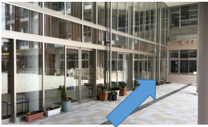
左側のインターホンです。