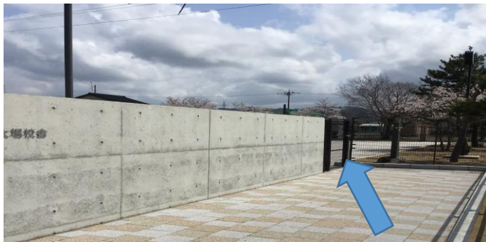
ロックされています。開けてください。