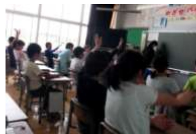
授業を参観し合い、話し合い、より良い授業づくりについて研究しています。