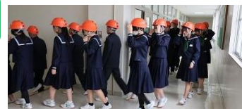
避難訓練(地震・津波)の様子

今年度に入り、避難訓練を2回行いました。どちらの避難訓練も、担任の先生からの事前指導をしっかりと聞いて、一人一人が真剣に取り組んでいました。