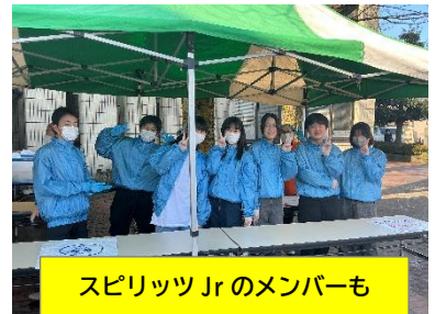
スピリッツJrのメンバーも 豚汁づくりを頑張っていました