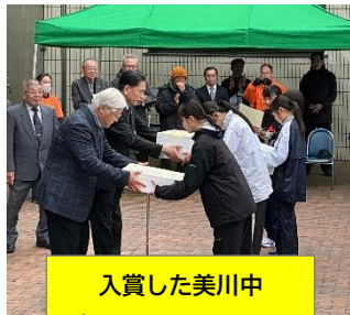
入賞した美川中 バドミントンCチーム

2年ぶりに開催された美川一周耐寒継走には、美川中から（先生チームも含め）たくさんのチームが参加しました。選手への応援、ありがとうございました！