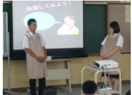
(右:妊婦疑似体験に挑戦し日常の大変さを感じる生徒)