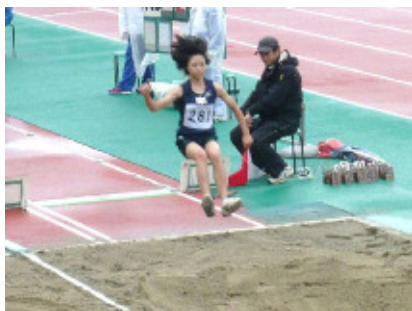
1・2年女子走幅跳 越中選手