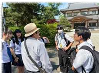
京都 ガイドさんとともに