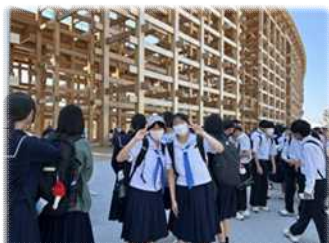
万博「大屋根リング」下にて