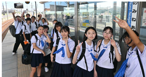
能美根上駅から金沢駅へ電車でGO！ ウキウキです