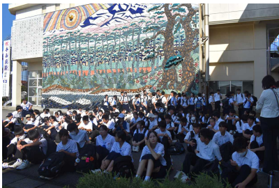
出発式 誰一人遅刻することなく 始めることができました！