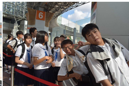
さあ、金沢駅から各自スポットへ出発 どんな旅になるかな？！

以降はすべて、生徒自身が撮影してきた写真です。 とっても充実した時間だったのが伝わってきますね～