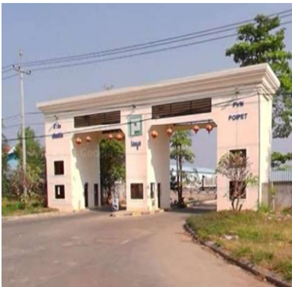
(左) 詐欺拠点の門扉