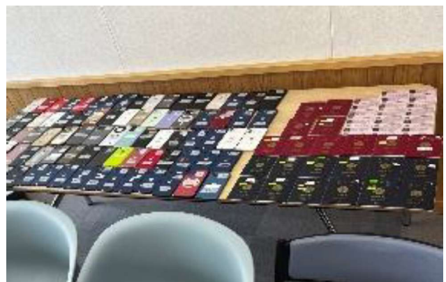
(右) 犯行グループが渡航者から没収していた携帯電話、パスポート、身分証等