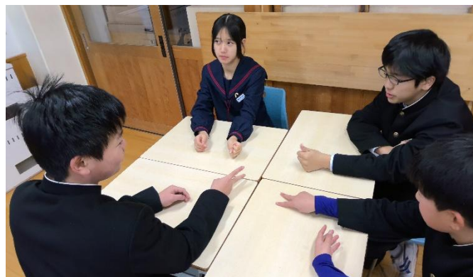
人間関係づくり～能都中わくわくトーク～の様子