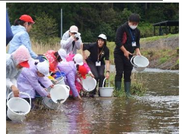
3,4年生 大海川でのアユの放流

大海小学校では豊富な地域の人材や素材を取り入れた授業を行っています。市からはこのような取り組みを応援する目的で補助金を頂いております。