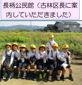
長柄公民館 (古林区長に案内していただきました)