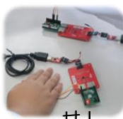
LEDライトを光らせるプログラミング