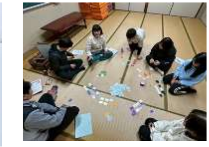
<カードゲームも楽しい！>