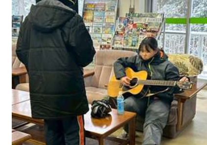
<やっぱりここでもギター>