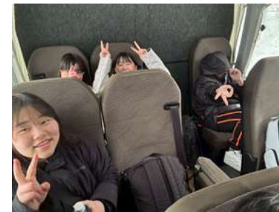
<バスの中も楽しく>

本年度も一里野温泉スキー場でスキー体験学習を行いました。素直な態度でスキーに取り組み、どんどん上達しました。また、白山ろく少年自然の家に宿泊し、仲間とともに楽しい一夜を過ごしました。