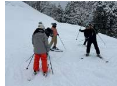
<上手になってきたかな？>