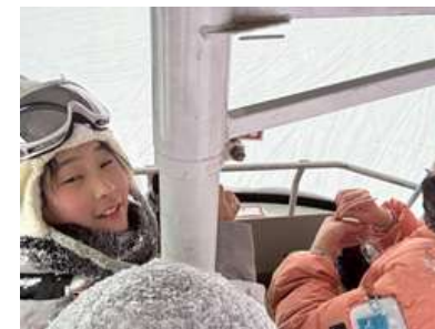
<ゴンドラたくさん乗りました>