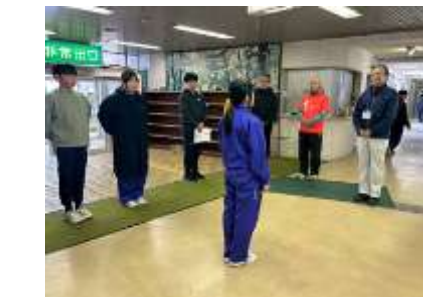
<感謝の気持ちで退所式>