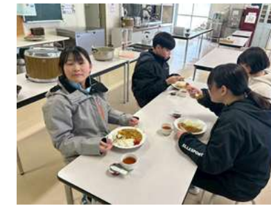
<やっぱりこのカレー！>