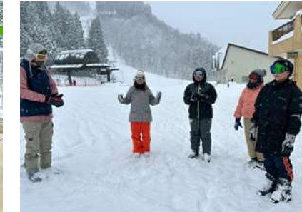
<いよいよ滑りますよ！>