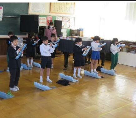
上手になったピアノ演奏を披露しました。