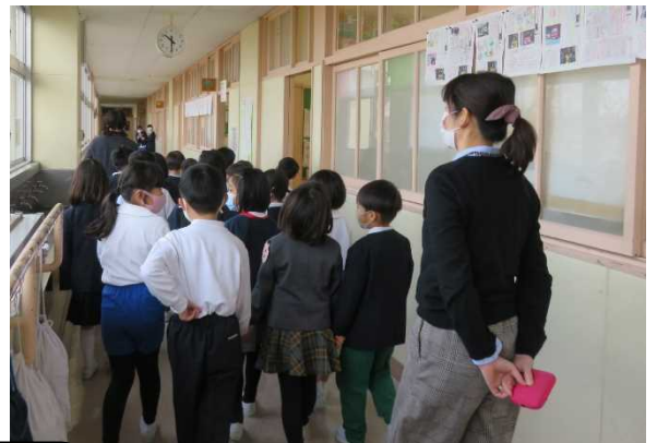
年長さんもここにここです。