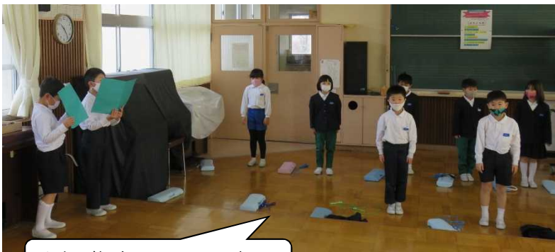
さあ、集会スタートです。

当日、年長さんが小学校に到着すると、緊張 MAX で大騒ぎでした。自分たちがお客さんと呼んで会を開くのが嬉しくてたまらない様子でした。当日の様子を写真でご覧ください。