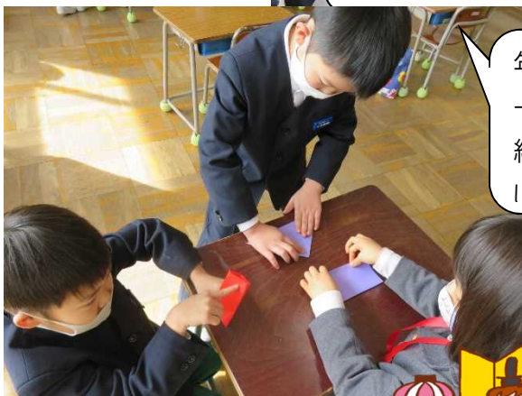
年長さんと一緒に折り紙で遊びました。