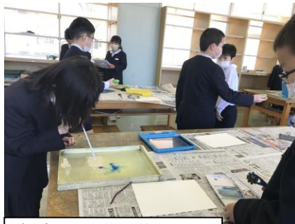
友達の活動の様子をよく見てまねする姿！