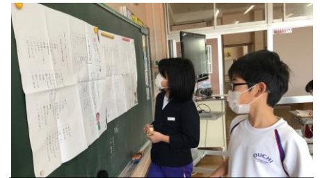
鑑賞。「言葉の宝箱」から言葉を選んで友達の作品を評価しています！