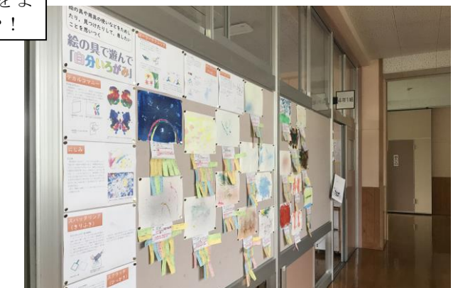
みなさんの作品は、このようにろう下に掲示してあります。先生も全員にコメントを書いたよ！