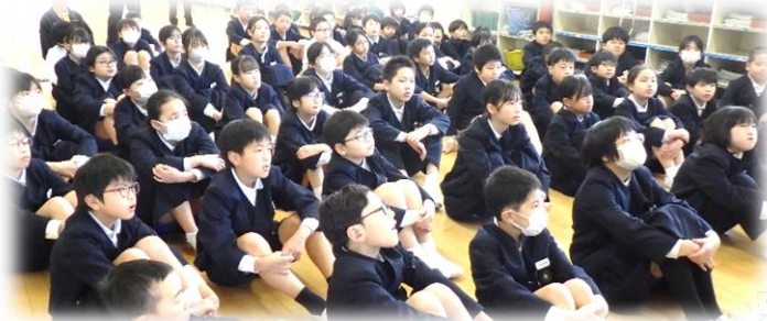
「聴く+考える」～自己の未来予想図を描く～

さて、6つの目指す姿(上表の項目)ですが、6人の教員が一項目を担当し、力説しました(右)。私は… ピンクレンジャー!