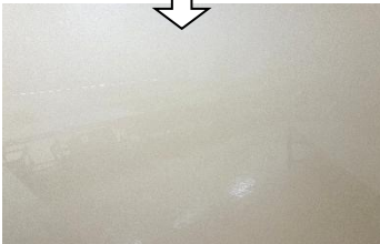
煙道体験会場(図工室)