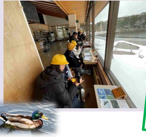
坂網の手慣れたさばき 加賀郷土かるたより 鴨の池

5年生は鴨池観察館を訪れました。たくさんの渡り鳥と雪の鴨池の美しさを十分に味わいました。レンジャーさんからの講義を通して、鴨をはじめ渡り鳥の生態や、鴨池観察館等についていろいろ学ぶことができました。加賀市の素敵なおとこをまた一つ発見しましたね。