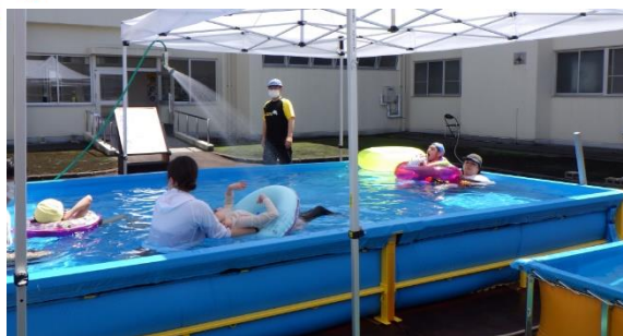
(昨年度のプール活動の様子)

中庭に、待望のプールが大小ふたつ設置されました。子どもたちは水に浮かぶ感覚、水中での動き易さを感じ、そして暑い日に水に入る爽快感を楽しみにしています。コロナ禍の中でも、感染症対策を施した上で、プール活動は継続してきました。梅雨の天候とも相談になりますが、夏空のもと、笑顔はじけるプール活動を満喫します。