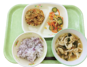
献立メニューの一例