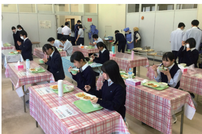
ランチルームの様子