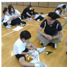
1年 紙飛行機飛ばし

特に、親子行事では、保護者の方とふれ合う子どもたちの表情はとても生き生きとして楽しそうでした。学級役員の方々が準備や話し合い、当日の司会進行等で大変ご協力いただきました。ありがとうございました。