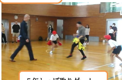
5年しっぽ取りゲーム