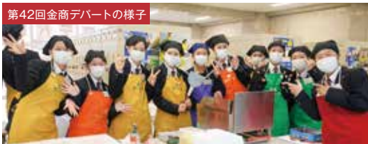
第42回金商デパートの様子