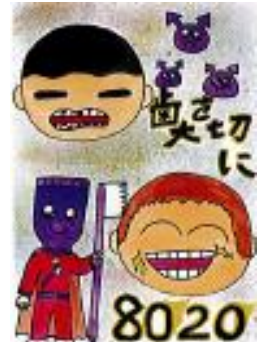
刀祢 伶羽 作