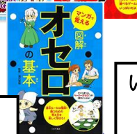
いわさき・ベストコレクション（6巻）