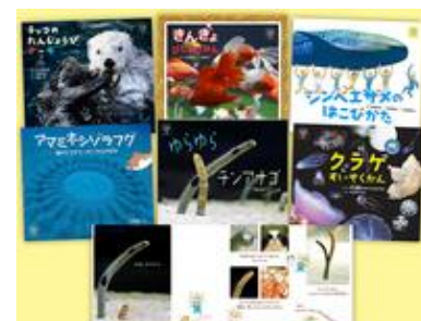
ほるぶ水族館えほんシリーズ（6巻）