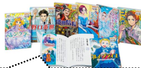
低学年から楽しめる、読み物伝記シリーズ