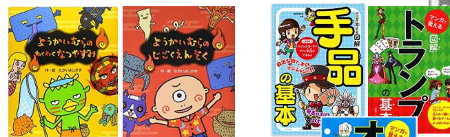
えほん・ようかいむら（5巻）