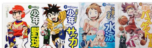
スポーツがうまくなる！シリーズ（6巻）